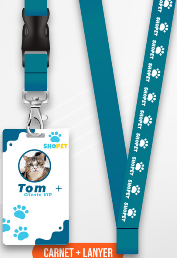
CARNET + LANYER